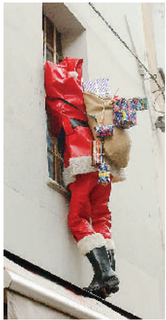
Decorazioni sui balconi

Ritornano su internet i balconi vercellesi addobbati per il Natale e, dopo gli ottimi risultati dello scorso anno, anche per il Natale 2007 ci sarà una gara tra quelli più illuminati e decorati. Fantasia al potere, quindi, per fantasmagorie di luci e colori, per Babbo Natale, per renne e slitte, per pupazzi di neve e stelle comete, sulle facciate e sulle ringhiere, protagonisti delle inaspettate luminarie all'esterno delle case. Ad organizzare sul web questa gara natalizia vercellese sono, in collaborazione, il sito internet Ver-